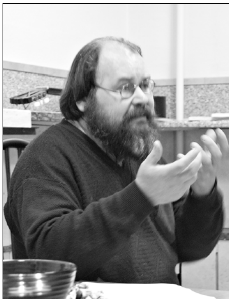
фото иерод. Феофила

университетского храма во имя святого праведного Иоанна Кронштадтского, преподаватели и студенты. Теперь есть и название — «Три свечи», и это отражено в интерьере: на каждом столе три свечечки.