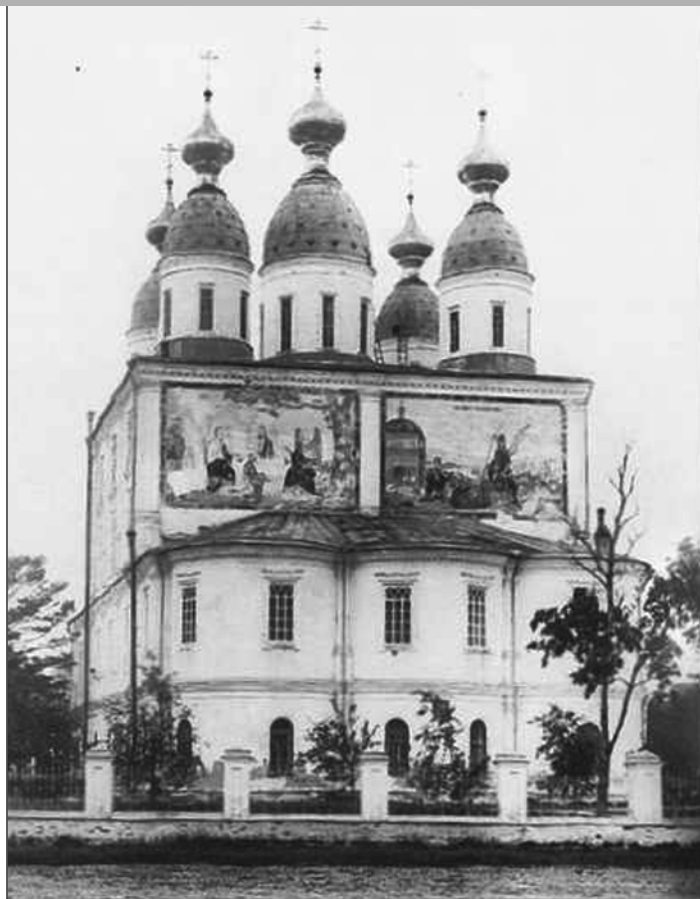
Фото начала XX в.

На снимке: Троицкий собор со стороны «Троицкого Пассажа».