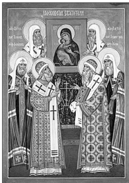
Святители Московские Петр, Алексий, Иона, Филипп, Ермоген и Тихон.

18 октября — святителей Петра, Алексия, Ионы, Филиппа и Ермогена, Московских и всея России чудотворцев.