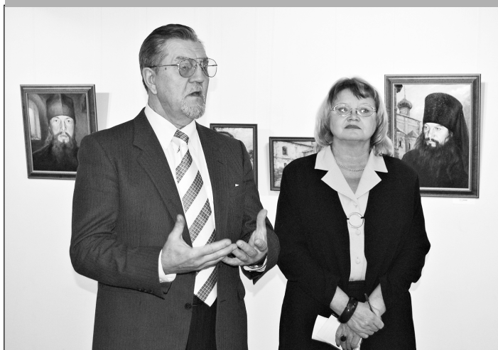
фото иерод. Феофила