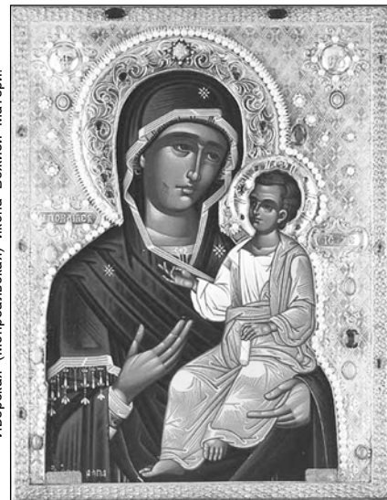
Иверская (Монреальская) икона Божией Матери.

26 октября — Иверской иконы Божией Матери (принесение в Москву в 1648 г.).